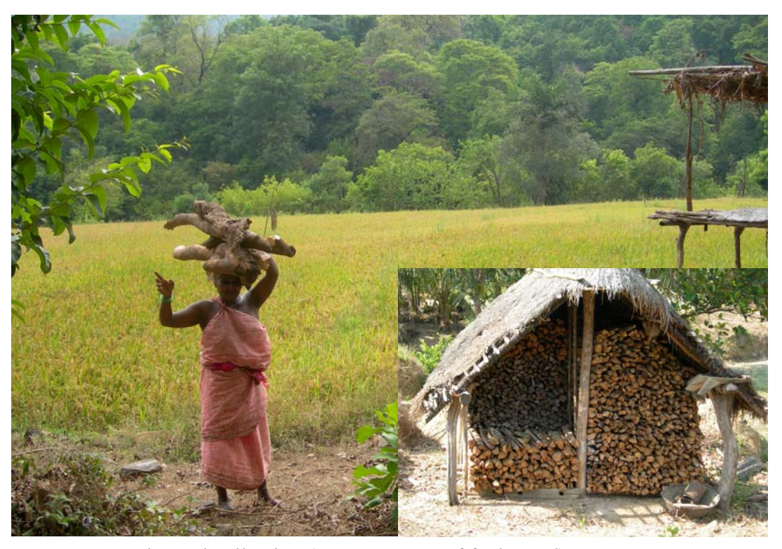
Fuel wood collection (Inset: Storage of fuel wood)