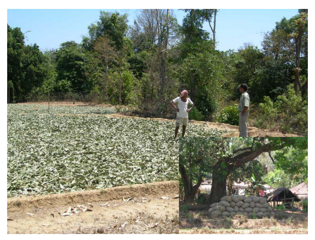
Collection of Cinnamon leaves (Inset: Storing leaves in gunny bags)