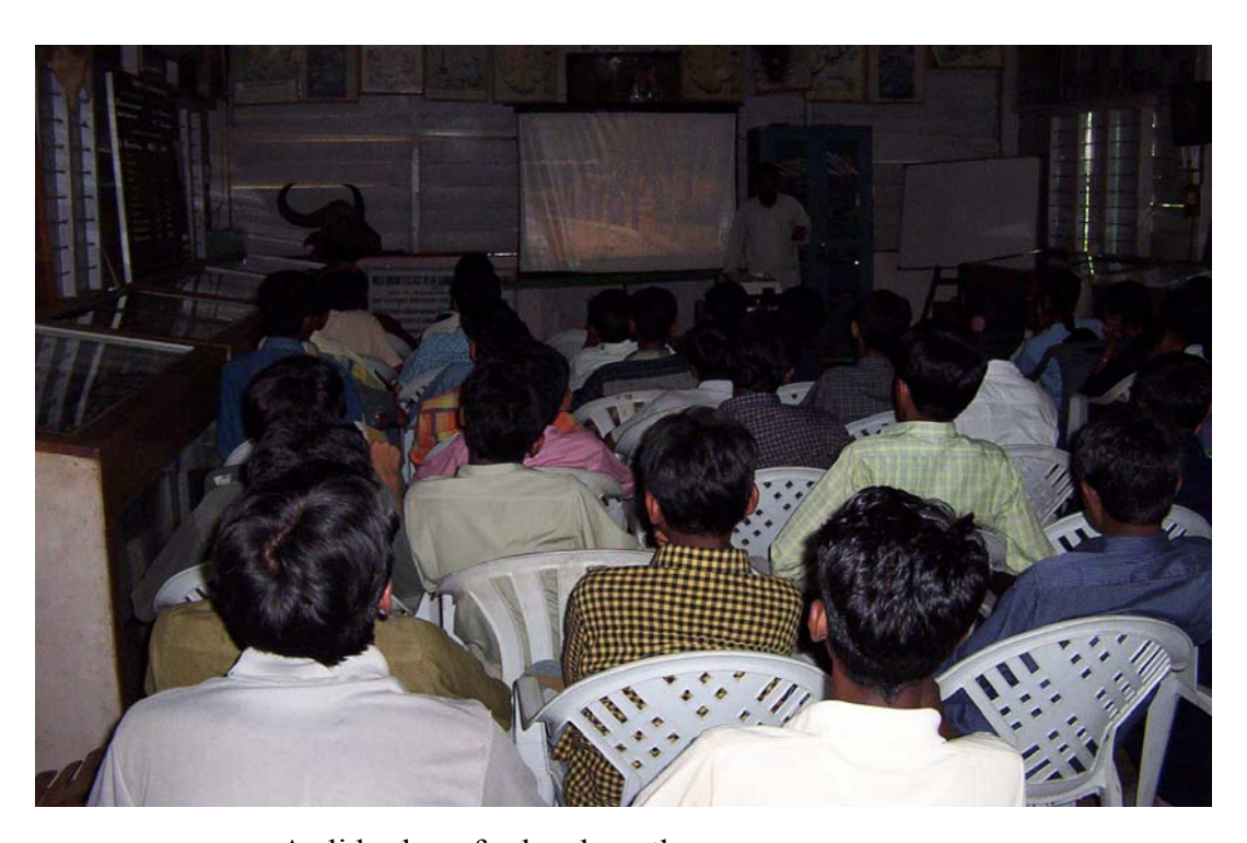
A slide show for local youth