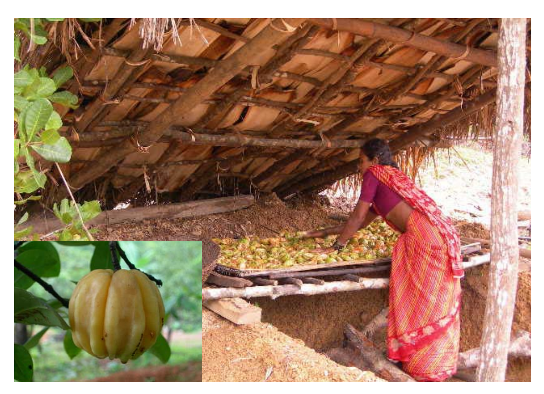
Drying of Garcinia gummi-gutta a commercial harvested NTFP (Inset: Fruits of G. gummi-gutta )