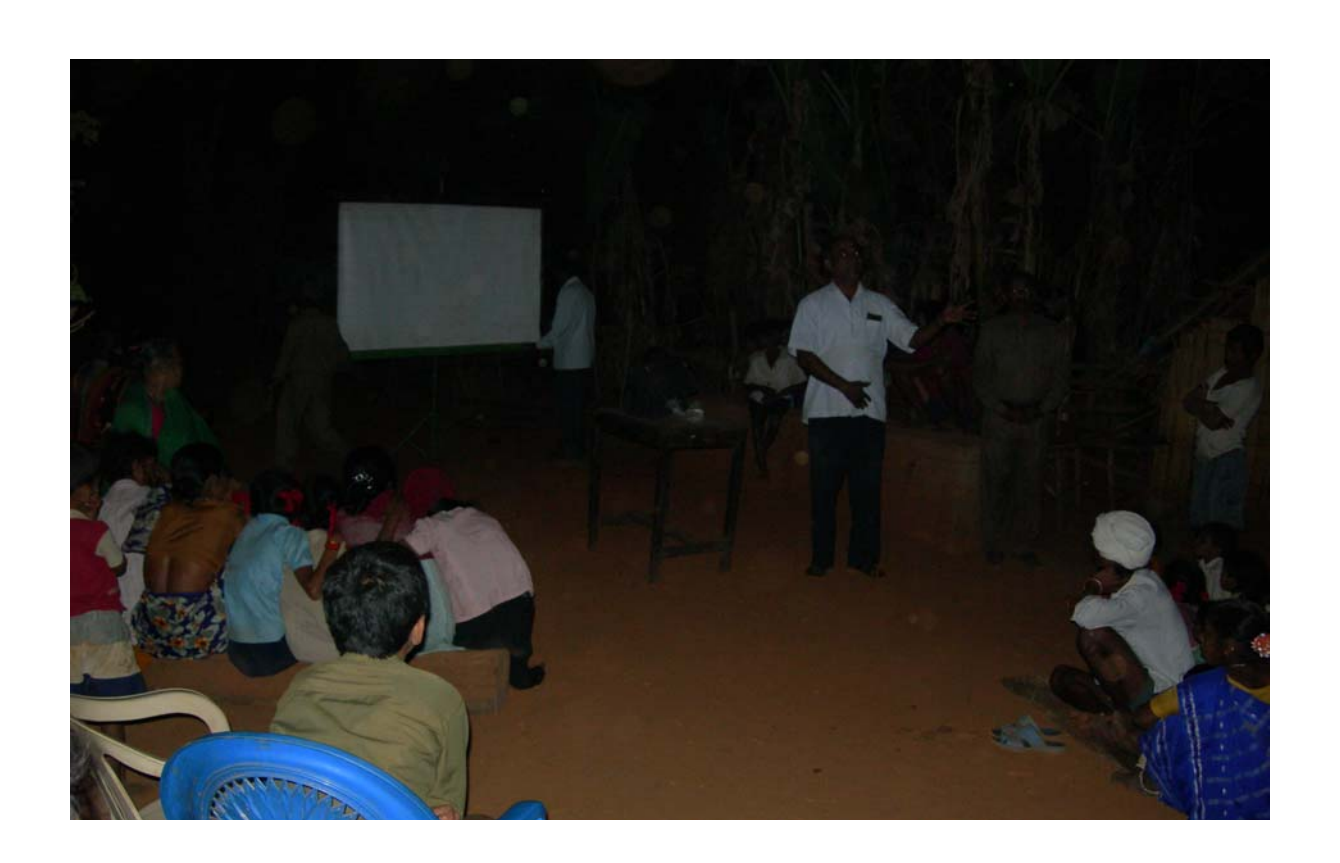
A slide show being arranged in a village